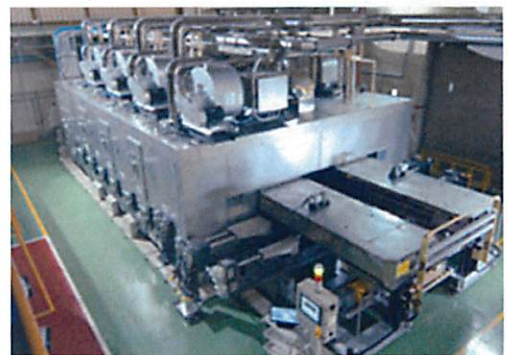
フィルム・シート製造装置