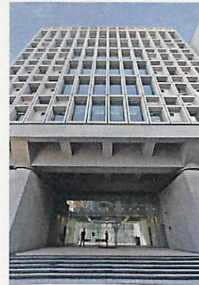
本社自社ビル(山手線大塚駅徒歩2分)

事業内容 河川計画、水管理、総合土砂管理、砂防計画、 海岸・海洋、河川構造、砂防施設、下水道、 防災、交通、道路、橋梁、流域文化、川づくり、 自然環境、環境アセスメント、環境モニタリング、 模型実験、機械電気設備、ICT、 インフラマネジメント、事業マネジメント、 国際協力