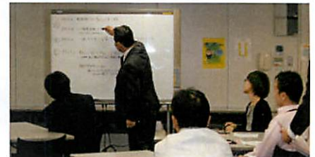
真の課題解決にチャレンジ (社内のディスカッションの様子)

■その他：学業等を考慮し、1日で体感可能なイベントです。ご理解の上、エントリーをしてください。 また、終日拘束となりますので、昼食はこちらで準備します。