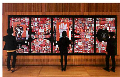
デジタルインフォメーションウォール

プログラムで動く動物たちが、オフィスへ来たお客さまを会議室までご案内。二度と同じ映像が繰り返されることがない、インタラクティブな映像群。