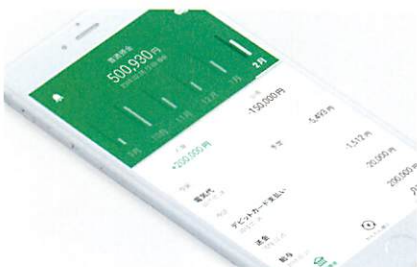
りそなグループアプリ

スマホアプリの、企画・デザイン、UI/UX設計、開発、また、プロモーション戦略の立案、プロモーションサイトとプロモーションムービーの制作を担当。