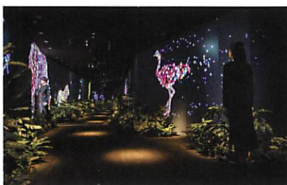
動物が住まうオフィス

JR東日本ウォータービジネス社と「イノベーション自販機」のプロデュース、サイネージアプリケーション企画・開発・デザインや、連動するスマホアプリを開発。