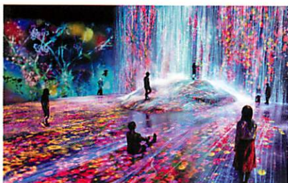
Mori Building DIGITAL ART MUSEUM: teamLab Borderless

空間演出: Unity, Touchdesigner, openFrameworks Web開発: Java, GO, PHP, Ruby, JavaScript, AWS アプリ開発: Swift, Kotlin, Cocos2d-x ハードウェア・電子工作: Arduino, Raspberry Pi, ROS 機械学習: Python, TensorFlow, OpenCV, MTurk