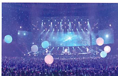
チームラボボール

520台のコンピューター、470台のプロジェクターを利用した、巨大デジタルアートミュージアム