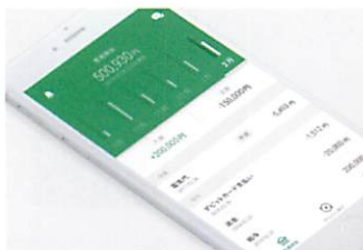
りそなグループアプリ