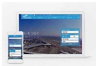
成田国際空港Webサイト・ロゴリニューアル