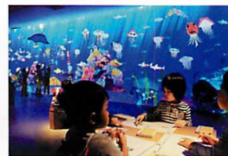
チームラボ 学ぶ! 未来の遊園地