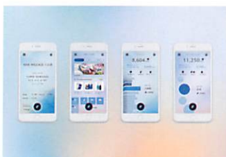
ANAマイレージクラブ アプリ