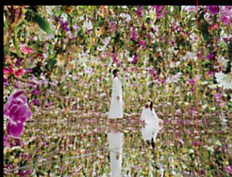
チームラボプラネッツ TOKYO DMM (豊洲)