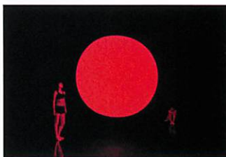
teamLab & TikTok, teamLab Reconnect: Art with Rinkan Sauna