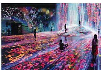
MORI Building DIGITAL ART MUSEUM: teamLab Borderless