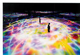
teamLab Planets TOKYO