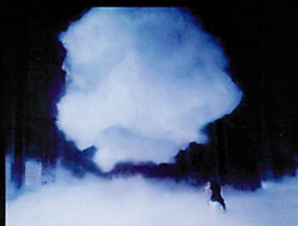
Every Wall is a Door (マイアミ)