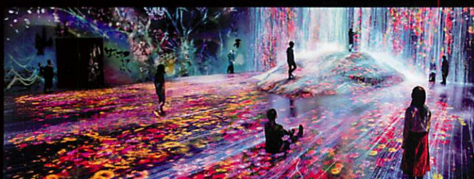
森ビルデジタルアートミュージアム: エプソン チームラボポータルレス (お台場)