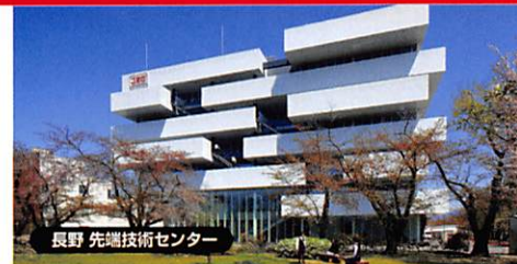
長野 先端技術センター

私たちは「無線通信技術・情報技術」のパイオニアメーカーとして、1915年の創立以来101年にわたり世界初・国内初の製品を数多く開発し世の中へ送り出してきました。現在はおもに3つの事業分野で、多岐にわたる製品・システムをグローバルに展開し、暮らしの「安全・安心」を支えています。