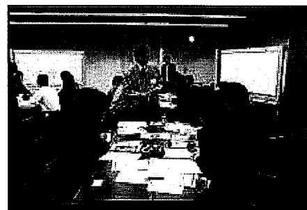
※グループワークでは、YKKグループで働く先輩社員がアドバイスします。

YKKグループが培ってきた技術をケーススタディに行うイベントです。世界で認められている技術のこだわりポイントを確かめてください。グループワークでは、みなさんの研究テーマからどんな未来の製品や技術が創造できるのか、そしてどんな仕事スタイルがあるのかを予測し、ビジネス創造体験をしながら、数年後の自分の姿をイメージしてください。