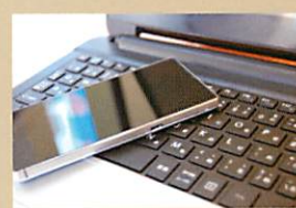
ポリフッ化ビニリデン