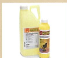
メトコナゾール (農薬)

世界で初めて大量生産 法を確立した生分解性 プラスチック (シェールガス掘削用途)