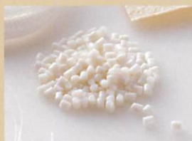
ポリグリコール酸

世界で初めて大量生産 法を確立した生分解性 プラスチック (シェールガス掘削用途)