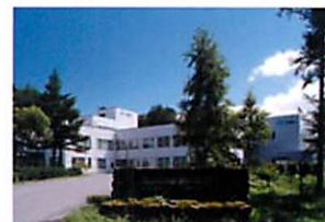
蓼科テクノパーク