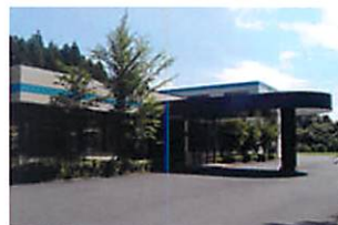
宇都宮テクノパーク

ものづくりセンター 受託設計グループ、宇都宮テクノパーク、蓼科テクノパーク 受託実績 HDD製造装置設計、レーザープリンター設計、宇宙実験装置製図、自動車エンジン部品加工機械設計、高圧燃料供給装置開発、小型CCDカメラ開発、半導体製造装置開発、液晶検査装置設計 他