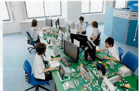
▲多くの評価行程を経て、高品質の製品がうまれます