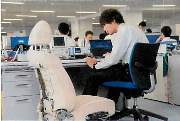
▲実際の製品に触れて開発できる恵まれた環境

システム全体を見据えた“モノづくり”ができる！ グループならではの環境とノウハウにより、『開発全工程を自社完結できる』のが弊社の強みです。ソフトウェアだけでなく、ハードウェア（メカ）も含めた視野で提案・実現し、実物を操作し、モノづくりの醍醐味を体験できます！