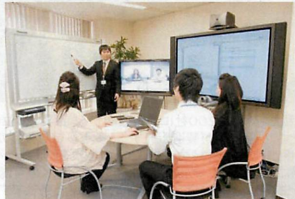
▲テレビ会議等をつかって国内外関係先とミーティング

福利厚生も充実しており、社員のサークル活動等や余暇支援も積極的におこなっています。 有給休暇も1日/月以上取得を推奨し、メリハリをつけた働き方ができます。