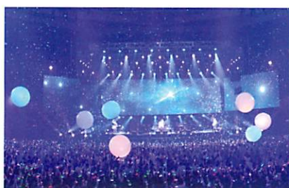
チームラボボール

520台のコンピューター、470台のプロジェクターを利用した、巨大デジタルアートミュージアム