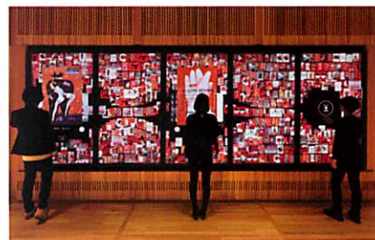
デジタルインフォメーションウォール

プログラムで動く動物たちが、オフィスへ来たお客さまを会議室までご案内。二度と同じ映像が繰り返されることがない、インタラクティブな映像群。