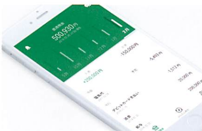
りそなグループアプリ

スマホアプリの、企画・デザイン、UI/UX設計、開発、また、プロモーション戦略の立案、プロモーションサイトとプロモーションムービーの制作を担当。