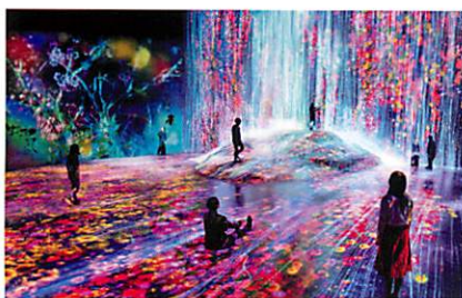
Mori Building DIGITAL ART MUSEUM: teamLab Borderless

空間演出:Unity, Touchdesigner, openFrameworks Web開発:Java, GO, PHP, Ruby, JavaScript, AWS アプリ開発:Swift, Kotlin, Cocos2d-x ハードウェア・電子工作:Arduino, Raspberry Pi, ROS 機械学習:Python, TensorFlow, OpenCV, MTurk