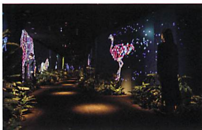
動物が住まうオフィス

JR東日本ウォータービジネス社と「イノベーション自販機」のプロデュース、サイネージアプリケーション企画・開発・デザインや、連動するスマホアプリを開発。