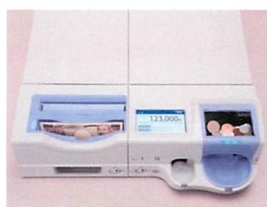
セルフレジは全国で活躍中