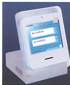
サーバー連動する次世代受付機