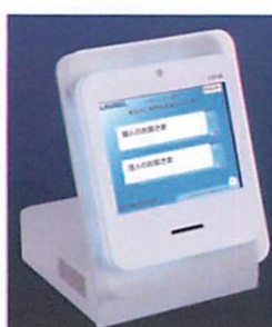
サーバー連動する次世代受付機