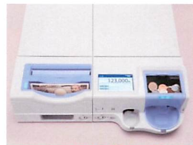
セルフレジは全国で活躍中