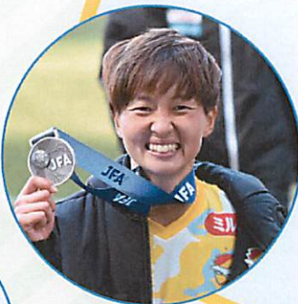
林 香奈絵 氏 なでしこジャパン 日本女子代表(2022)

IT企業の仕事内容 / 女性の働き方 / 将来像 / この会社に入った動機 / etc