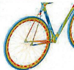
自転車のフレームにかかる応力を計算する (構造解析)