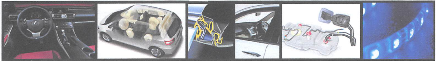
快適性向上 内装製品 生命を守る エアバッグ 軽量化 ドアまわりゴム製品 環境配慮 機能部品 次世代の光 LED