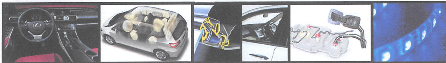
快適性向上 内装製品 生命を守る エアバッグ 軽量化 ドアまわりゴム製品 環境配慮 機能部品 次世代の光 LED