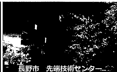
長野市 先端技術センター