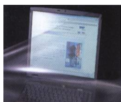
液晶ディスプレイ用 光学フィルム