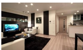
住宅内装用 化粧シート